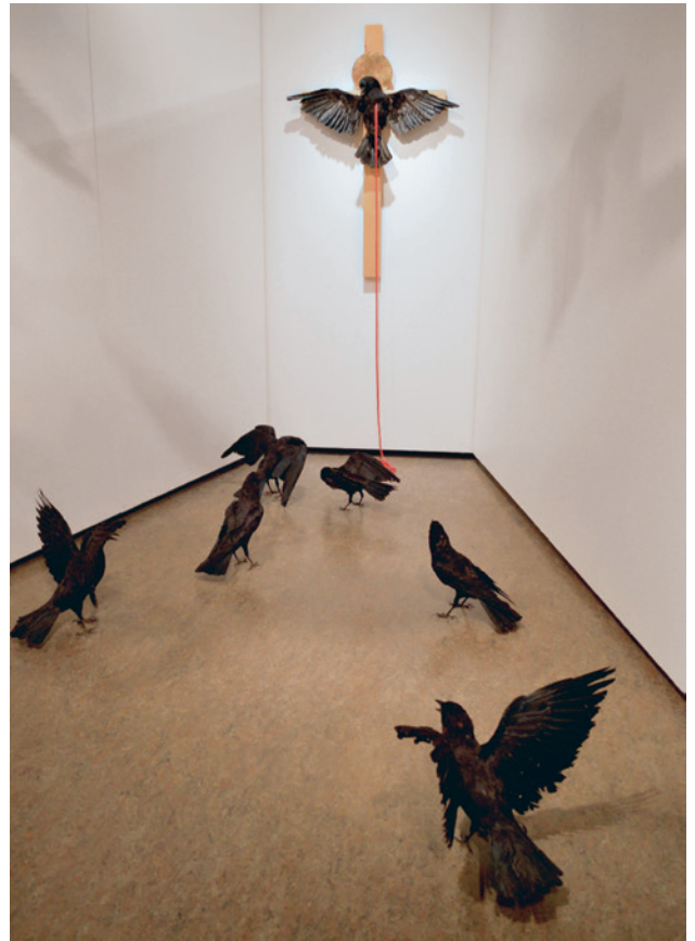
Kakakew, le messenger , 2014 Installation. Corneilles, croix de bois, et ruban