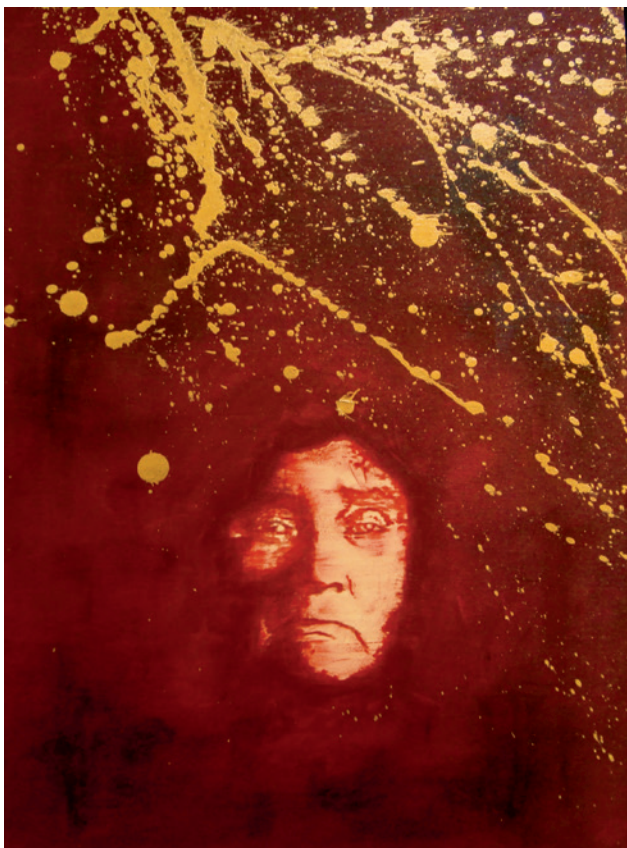
Matcaci , 2012 Acrylique sur bois et peinture en aérosol