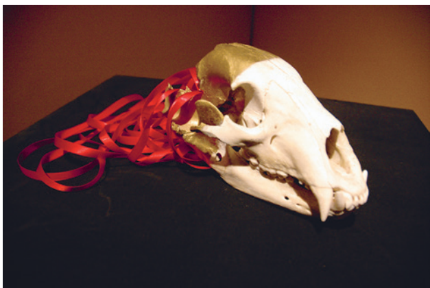
Fatalité , 2012 Crâne d'ours, peinture en aérosol et ruban de satin