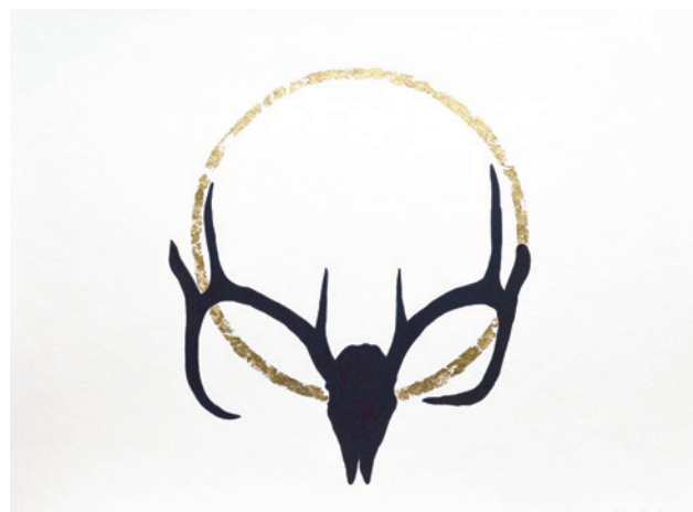
Sans titre , 2014 Papier aquarelle, encre et imitation feuilles d'or